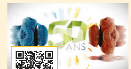
Flashez le QR code et (re)visionnez la vidéo réalisée il y a 10 ans.

Conscients du rôle essentiel de l'entreprise dans la société, nous avons, il y a 10 ans maintenant, souhaité ouvrir une voie, celle qui permet de croire à un projet et en un rêve où tout est possible.