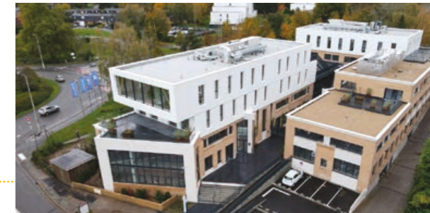
Triopolis à Villeneuve d'Ascq - Réhabilitation complète et surélévation (4 400m 2 bureaux) / Un bâtiment certifié BREEAM Very Good.

Face aux enjeux de la loi Climat et de la mutation des marchés, NORDCLIM renforce ses projets de réhabilitation, de sites industriels, de résidences services, de santé et d'hôtellerie pour permettre à chaque Homme de se réaliser dans son lieu de vie.